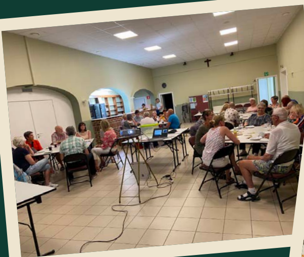
22 / 06 / 2022 Huurdersvergadering van Merckpoel & Residentie De Pillecyn