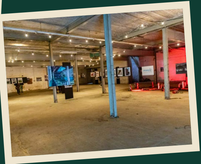
02 / 04 / 2022 Tasifest