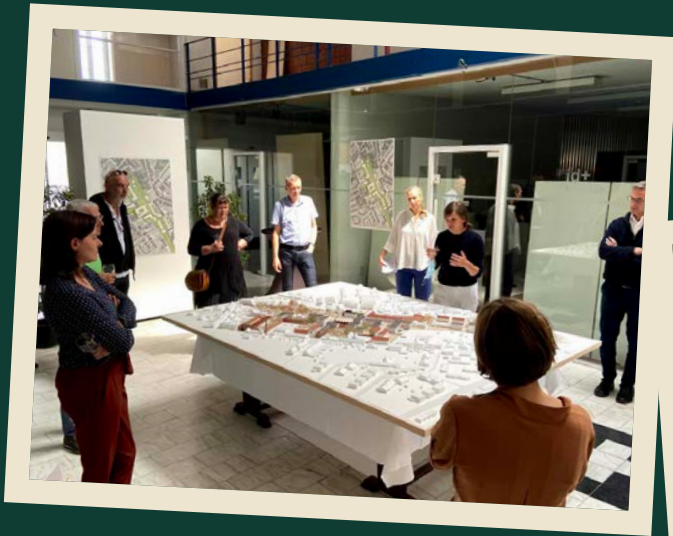
2019 100 jaar sociaal wonen