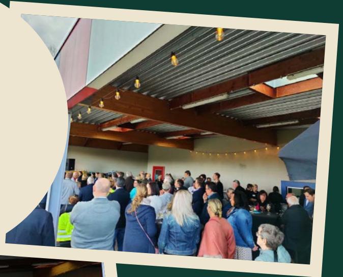
21 / 04 / 2023 Inhuldiging Dennenstraat Hamme